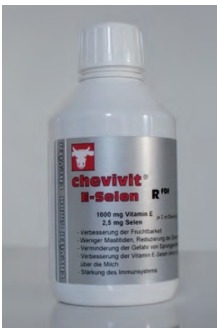
Abb. 4: Chevivit E-Selen® biotaugliches Ergänzungsfuttermittel – enthält Vitamin E und Selen