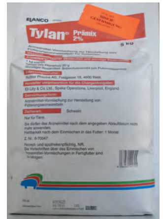
Abb. 7: Tylan – Arzneimittel mit Antibiotika