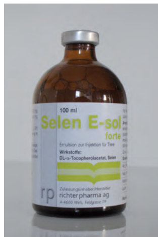
Abb. 5: Selen E-sol®-Arzneimittel – enthält Vitamin E und Selen

Das Injektionspräparat Selen E-Sol® (rechts, Abb. 5) ist ein Arzneimittel, während das über das Maul zu verabreichende Präparat Chevivit E-Selen® (links, Abb. 4)