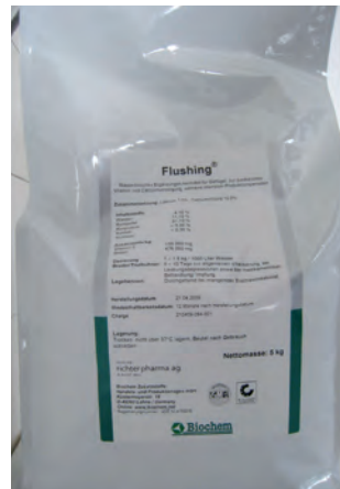
Abb. 6: Flushing – Ergänzungsfuttermittel

zwar ebenfalls Vitamin E und Selen als Wirksubstanzen enthält, aber als biotaugliches Futtermittel eingestuft ist.